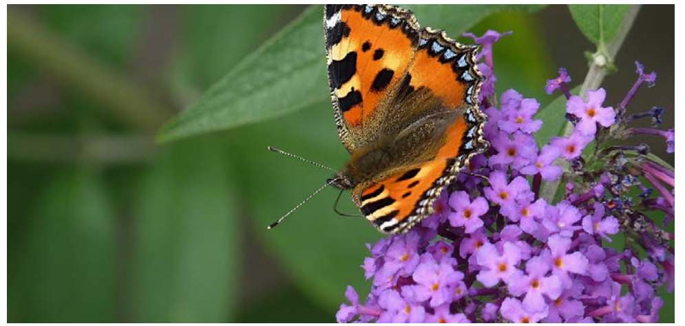
Kleiner Fuchs auf dem invasiven Schmetterlingsstrauch

Anmeldung/Infos unter www.pflanzenlabor.ch