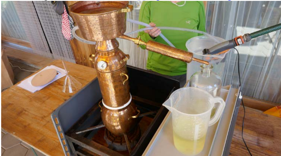
Selber Chörblichrutwasser destillieren

Anmeldung/Infos unter www.skepping.ch/veranstaltungen