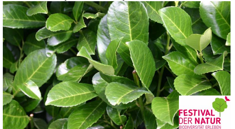
Weg mit der Hecke aus Kirschlorbeer!

Details siehe Lokalpresse und www.pronatura-be.ch