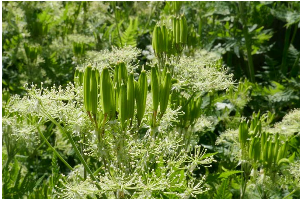
Chörblichrut – Süssdolde: Vortrag zur Heil-, Gewürz- und Genusspflanze

Im Schmidechäuer, Grabenstr. 8, Burgdorf