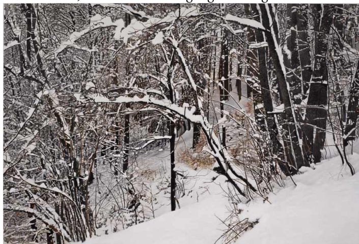
(Franz Gertsch: Die vier Jahreszeiten: Winter / Museum Franz Gertsch)

Siehe 3. Mai, Jahreszeitenrundgang Frühling