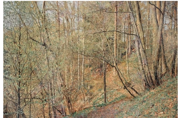
(Franz Gertsch: Die vier Jahreszeiten: Frühling / Museum Franz Gertsch)