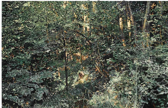
(Franz Gertsch: Die vier Jahreszeiten: Sommer / Museum Franz Gertsch)

Siehe 3. Mai, Jahreszeitenrundgang Frühling